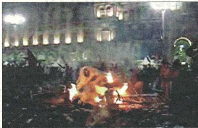
Nel fotogramma preso da un video una mucca bruciata in piazza Duomo